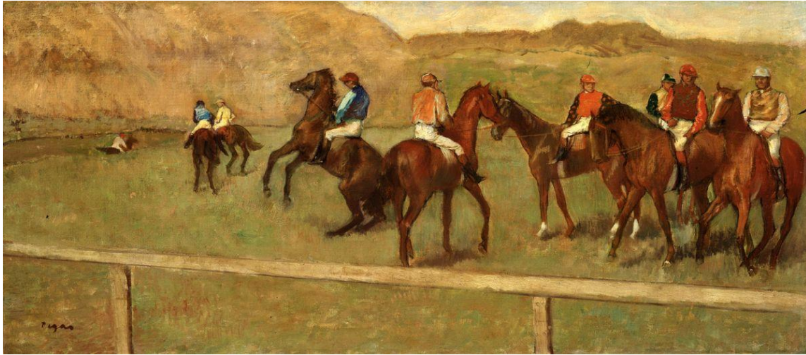
Edgar Degas, «Avant le départ» (1878/1880), Sammlung Emil Bührle, Dauerleihgabe im Kunsthaus Zürich.