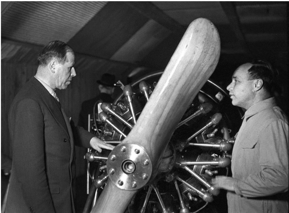
Unternehmer Emil Bührle (l.) zusammen mit einem Arbeiter anlässlich der Eröffnung der Elektrodenfabrik in Zürich-Oerlikon und der Abteilung für Flugzeugmotoren, aufgenommen 1942.