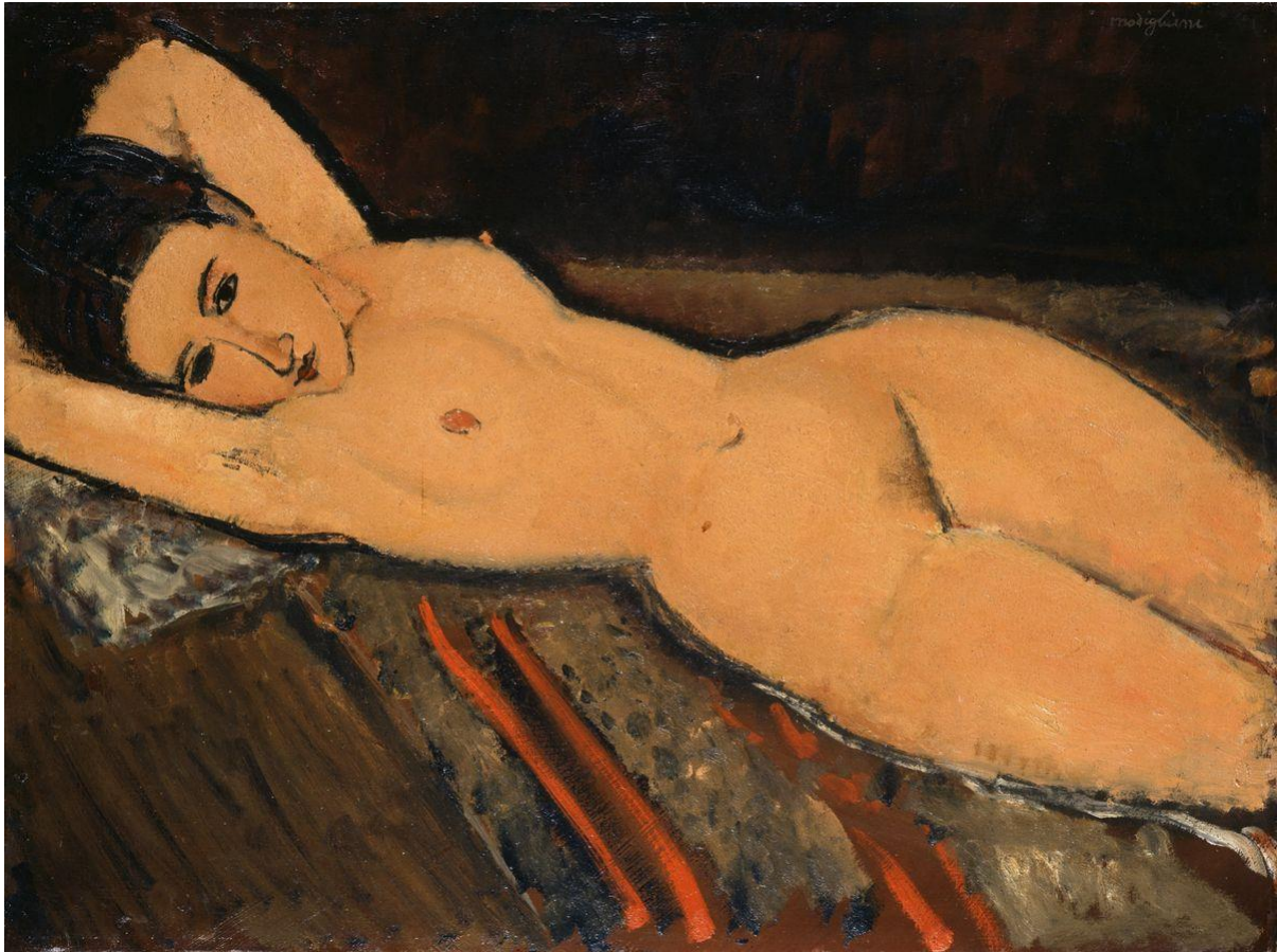
Amedeo Modigliani: «Liegender Akt» (1916), ein weiteres Gemälde aus der Sammlung Emil Bührle.

Unbestritten ist, dass das Kunsthaus als öffentlich finanzierte Einrichtung und als Mitglied des Internationalen Museumsrates Icom ethische Richtlinien und speziell die von 43 Staaten unterzeichneten Verpflichtungen des Washingtoner Abkommens von 1998 einhalten muss. Dieses strebt in Fällen von NS-verfolgungsbedingtem Vermögensentzug «faire und gerechte Lösungen» mit den Nachkommen der ehemaligen Besitzer an.