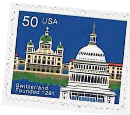
Die Gemeinschaftsbriefmarke Schweiz - USA aus dem Jahre 1991 als Symbol der Verbundenheit. HO