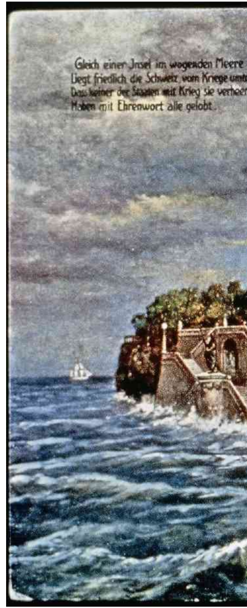
Postkarte aus der Zeit des Ersten Weltkrieges. Die Schweiz sieht sich als sichere Insel in der gefährlichen Brandung.